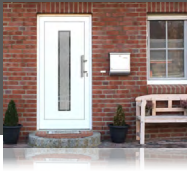
SINGLE außen: Klarglas Mitte mattiert mit klarem Rand innen: Klarglas wärmebeschichtet Mindestmaß: 270 x 1610 mm • Farbe: RAL 9016 weiß