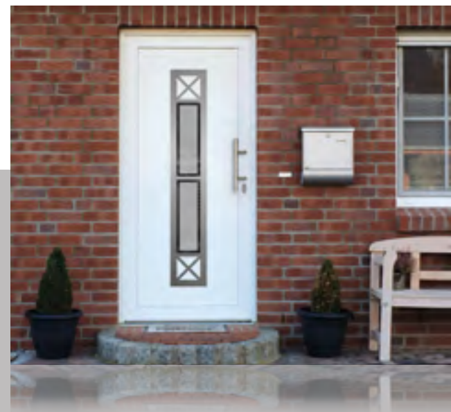
APART 01 außen: Klarglas Mitte mattiert mit klarem Rand innen: Klarglas wärmebeschichtet Farbe: RAL 9016 weiß • Mindestmaß: 330 x 1600 mm