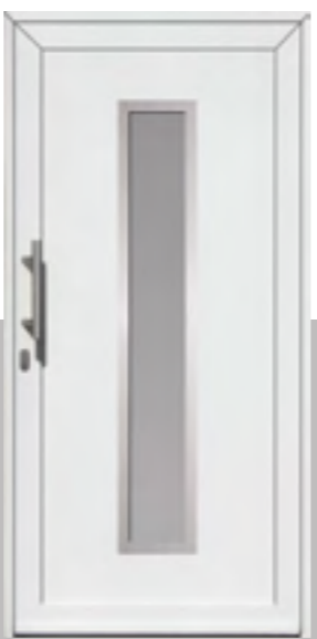
KOBLENZ außen: Klarglas beschichtet innen: Klarglas wärmebeschichtet Mindestmaß: 330 x 1660 mm Farbe: RAL 9016 weiß