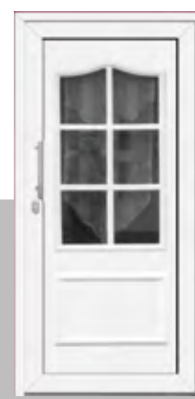
ECCO außen: Klarglas plan innen: Klarglas wärmebeschichtet Farbe: RAL 9016 weiß Mindestmaß: 650 x 1690 mm HT 345 x 1690 mm ST