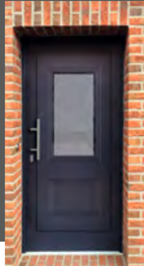
MAGMA außen: Klarglas Mitte mattiert mit klarem Rand innen: Klarglas wärmebeschichtet Farbe: stahlblau Mindestmaß: 540 x 1600 mm mit Nutendesign außen