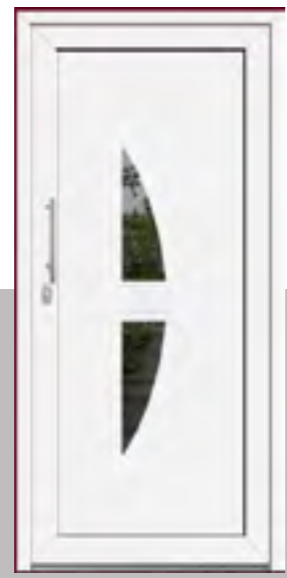
INCA außen: Klarglas plan innen: Klarglas wärmebeschichtet Mindestmaß 510 x 1620 mm HT Farbe: RAL 9016 weiß