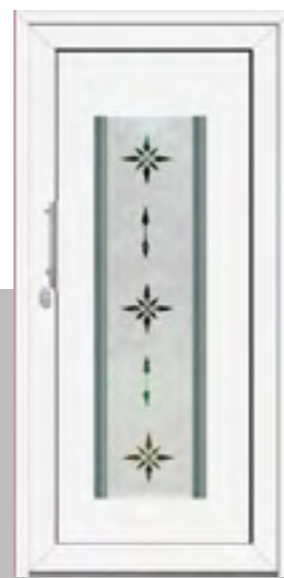
TAURUS außen: Klarglas mit Sandstrahlmotiv „Alexandria“ innen: Klarglas wärmebeschichtet Mindestmaß: 560 x 1660 mm Farbe: RAL 9016 weiß