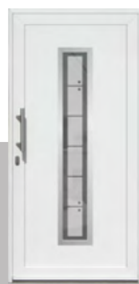
APART 02 außen: Klarglas mit Sandstrahlmotiv G9030 innen: Klarglas wärmebeschichtet Mindestmaß: 330 x 1660 mm Farbe: RAL 9016 weiß