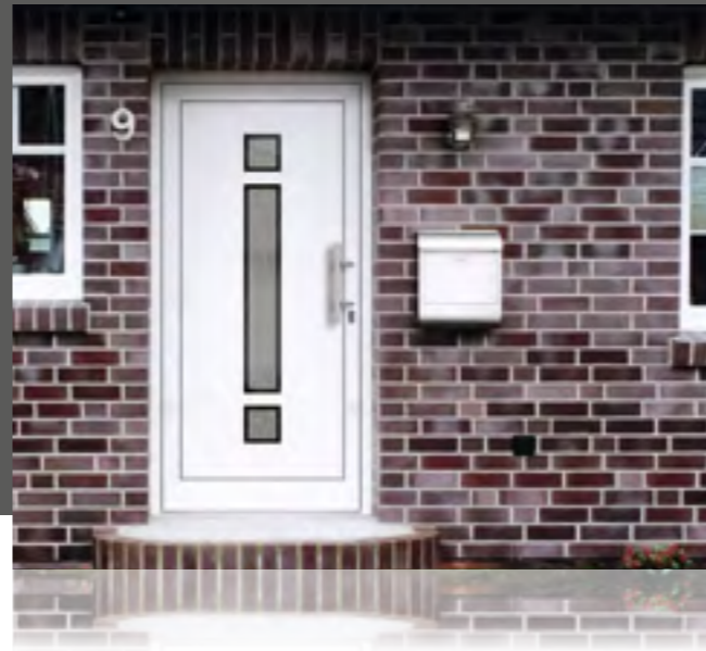
MOTION außen: Klarglas Mitte mattiert mit klarem Rand innen: Klarglas wärmebeschichtet Mindestmaß: 240 x 1600 mm • Farbe: RAL 9016 weiß