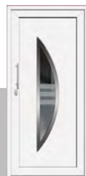
URSEL außen: Klarglas mit Sandstrahlmotiv Husum innen: Klarglas wärmebeschichtet Farbe: RAL 9016 weiß Mindestmaß: 340 x 1630 mm