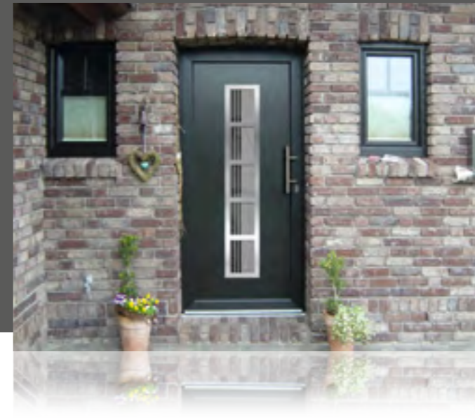
APART 03 außen: Klarglas mit Sandstrahlmotiv G7010 innen: Klarglas wärmebeschichtet Farbe: tannengrün • Mindestmaß: 330 x 1660 mm