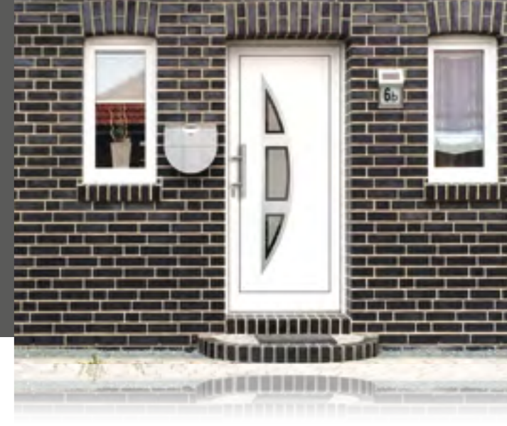
LUXOR außen: Klarglas Mitte mattiert mit klarem Rand innen: Klarglas wärmebeschichtet Farbe: RAL 9016 weiß • Mindestmaß: 340 x 1660 mm außen mit Rahmen in Edelstahloptik