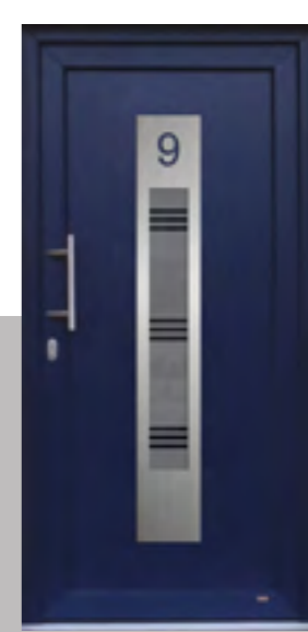
APART 06 außen: Klarglas mit Sandstrahlmotiv G2010 innen: Klarglas wärmebeschichtet Farbe: stahlblau Mindestmaß: 330 x 1660 mm auf Wunsch mit Hausnummer inklusive