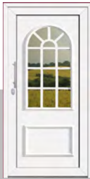
ERGO außen: Klarglas plan innen: Klarglas wärmebeschichtet Mindestmaß 640 x 1640 mm HT 305 x 1640 mm ST Farbe: RAL 9016 weiß