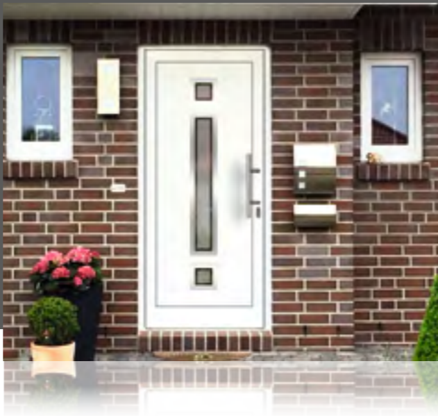
PRIMERA außen: Klarglas Mitte mattiert mit klarem Rand innen: Klarglas wärmebeschichtet Mindestmaß: 270 x 1560 mm • Farbe: RAL 9016 weiß außen mit Rahmen in Edelstahloptik