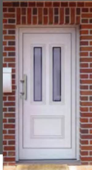
SPIRIT außen: Klarglas Mitte mattiert mit klarem Rand innen: Klarglas wärmebeschichtet Farbe: RAL 9016 weiß Mindestmaß: 560 x 1600 mm mit Nutendesign außen