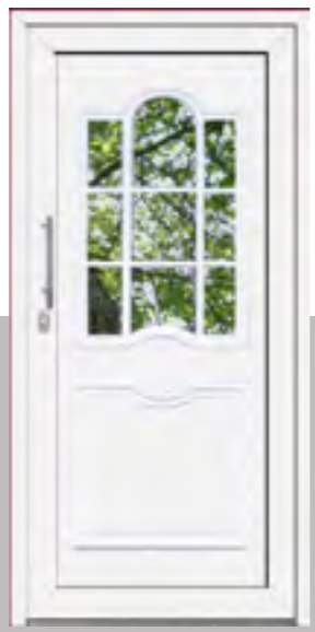
MILAN außen: Klarglas plan innen: Klarglas wärmebeschichtet Mindestmaß 640 x 1665 mm HT 330 x 1665 mm ST Farbe: RAL 9016 weiß