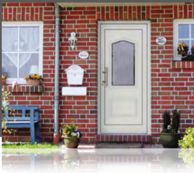
REGENTA außen: Klarglas Mitte mattiert m. klarem Rand innen: Klarglas wärmebeschichtet außen mit Nutendesign Mindestmaß: 640 x 1690 mm • Farbe: RAL 9016 weiß